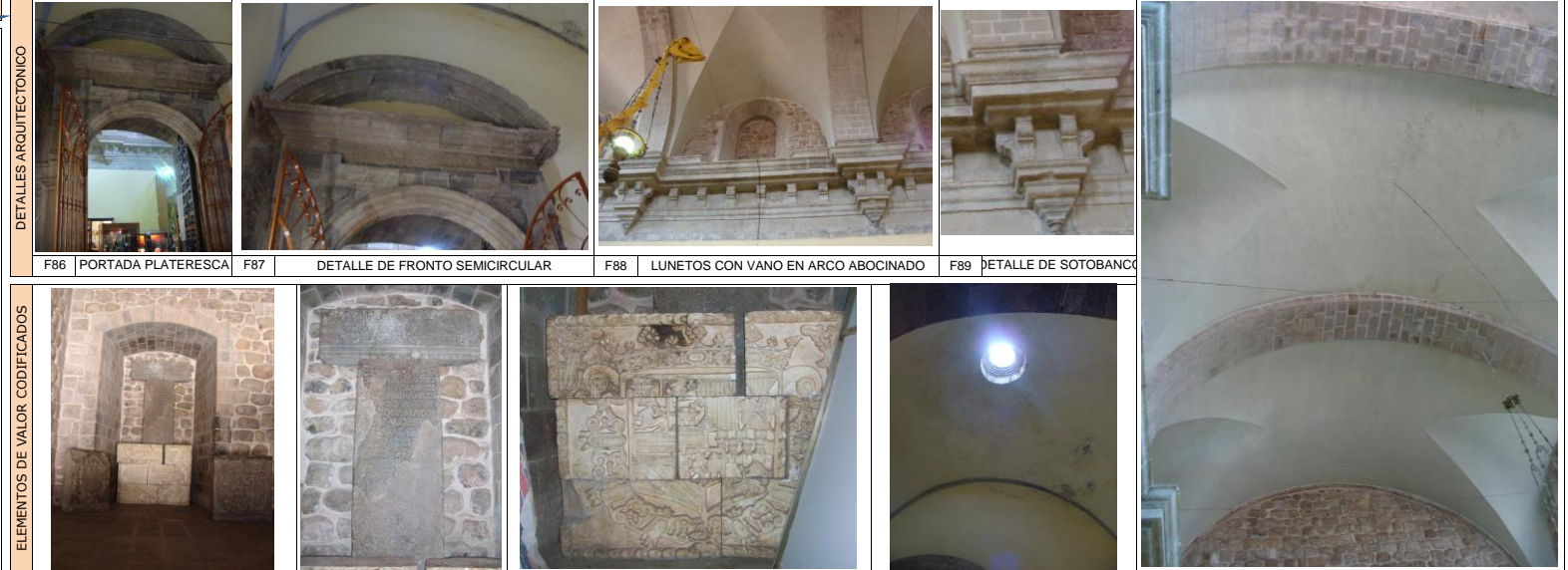
F86 PORTADA PLATERESCA F87 DETALLE DE FRONTO SEMICIRCULAR F88 LUNETOS CON VANO EN ARCO ABOCINADO F89 DETALLE DE SOTOBANCO F810 VANO CLAUSURADO DE ACCESO AL TEMPLO F811 INSCRIPCIONES SACRAS F812 INSCRIPCIONES SACRAS F813 CBUERTA CON BOVEDA VAIDA F814 CUBIERTA CON BOVEDA DE LUNETOS ESTRUCTURADO POR ARCS FORMEROS.

TECNICO CATALOGADOR 1: Bch. Amparo M. Meléndez Torres CORDINADOR DE BRIGADA Arqta. Yadira Guerra Vera FECHA 2 | 2 | 0 | 8 | 1 | 2