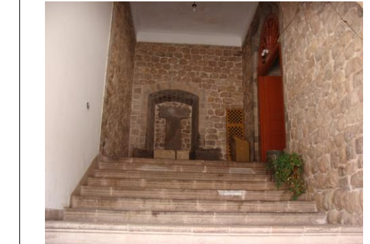
F85 VISTA DEL ACCESO A LA ANTIGUA SACRISTIA

LA ANTIGUA SACRISTIA DEL ACTUALMENTE SE ACCEDI POR CLAUSTRO DEL CONVENTO JESUITA, SIENDO (HOY MUSEO UNIVERSITARIO) A TRAVES DE UNA ESCALERA DE PIEDRAS DONDE SE ENCUENTRA UN VANO CLAUSURADO QUE COMUNICA AL TEMPLO. EN ESTE SE ENCUENTRA LITOS CON INSCRIPCIONES SACRAS, A UN LADO MUESTRA UN PORTON EN ARCO DE MEDIO PUNTO EN EL INTERIOR MUESTRAS DOS AMBIENTES, UNA PORTADA PLATERESCA. EL AMBIENTE PRINCIPAL, ESTRUCTURADO POR ARCOS FORMEROS QUE SOSTIENE UNA CUBIERTA CON BOVEDAS DE LUNETO