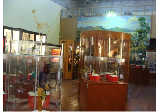
F83 VISTA INTERIOR DEL ACTUAL MUSEO UNIVERSITARIO