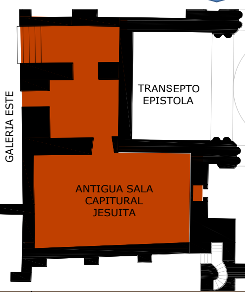
F82 ANTIGUA SAL CAPITAL JESUITA

LA ANTIGUA SACRISTIA DEL ACTUALMENTE SE ACCEDI POR CLAUSTRO DEL CONVENTO JESUITA, SIENDO (HOY MUSEO UNIVERSITARIO) A TRAVES DE UNA ESCALERA DE PIEDRAS DONDE SE ENCUENTRA UN VANO CLAUSURADO QUE COMUNICA AL TEMPLO. EN ESTE SE ENCUENTRA LITOS CON INSCRIPCIONES SACRAS, A UN LADO MUESTRA UN PORTON EN ARCO DE MEDIO PUNTO EN EL INTERIOR MUESTRAS DOS AMBIENTES, UNA PORTADA PLATERESCA. EL AMBIENTE PRINCIPAL, ESTRUCTURADO POR ARCOS FORMEROS QUE SOSTIENE UNA CUBIERTA CON BOVEDAS DE LUNETO