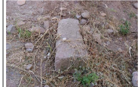
M64 DETALLE DE E.M10-PATIO LATERAL