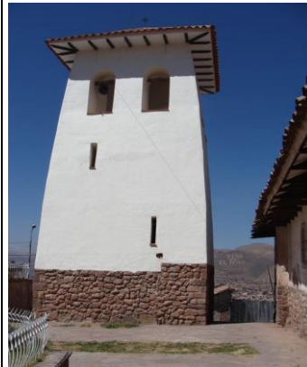
M66 E.M11: SOBRECIMIENTO DEL CAMPANARIO EXENTO