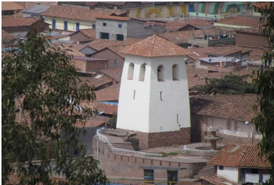
M65 CAMPANARIO EXENTO