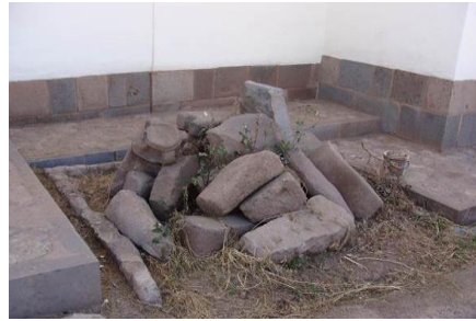
M62 DETALLE DE E.M10-PATIO LATERAL