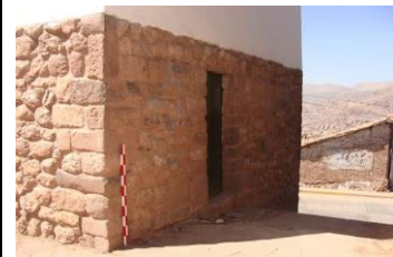
M68 DETALLE DE E.M11