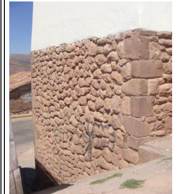
M70 DETALLE DE E.M11