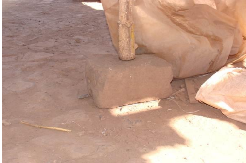
M61 DETALLE DE E.M10-PATIO TESTERO