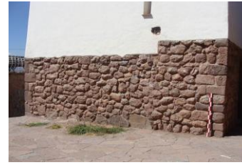
M67 DETALLE DE E.M11