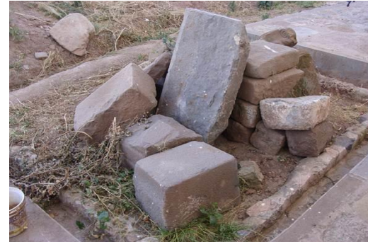
M63 DETALLE DE E.M10-PATIO LATERAL